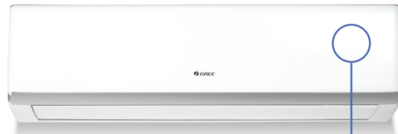
Unité murale LOMO 18