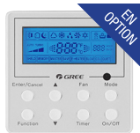
Thermostat filaire (XK-41)