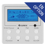
Thermostat filaire (XE-71)