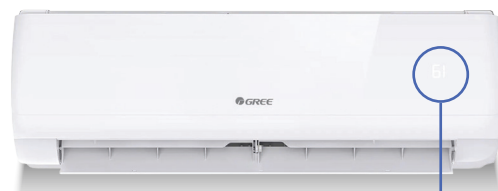
Unité murale VITA